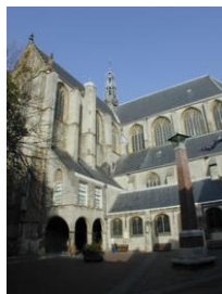
3 Grote of Sint Laurenskerk