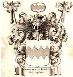
1 Foreest wapen

1 Wilhelm van Foreest (Foresto) (afb. 1). Wilhelm trouwde met Machteld van Foreest . Machteld is geboren in 1250.