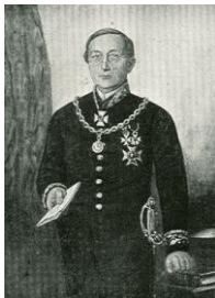
2 Joost van Vollenhoven Burgemeester van Rotterdam

1 Joost van Vollenhoven (afb. 2), geboren op zondag 6 februari 1814 in Rotterdam. Joost is overleden op maandag 23 september 1889 in Rotterdam, 75 jaar oud.