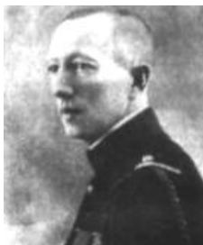
4 Joost van Vollenhoven gouverneur van indochina